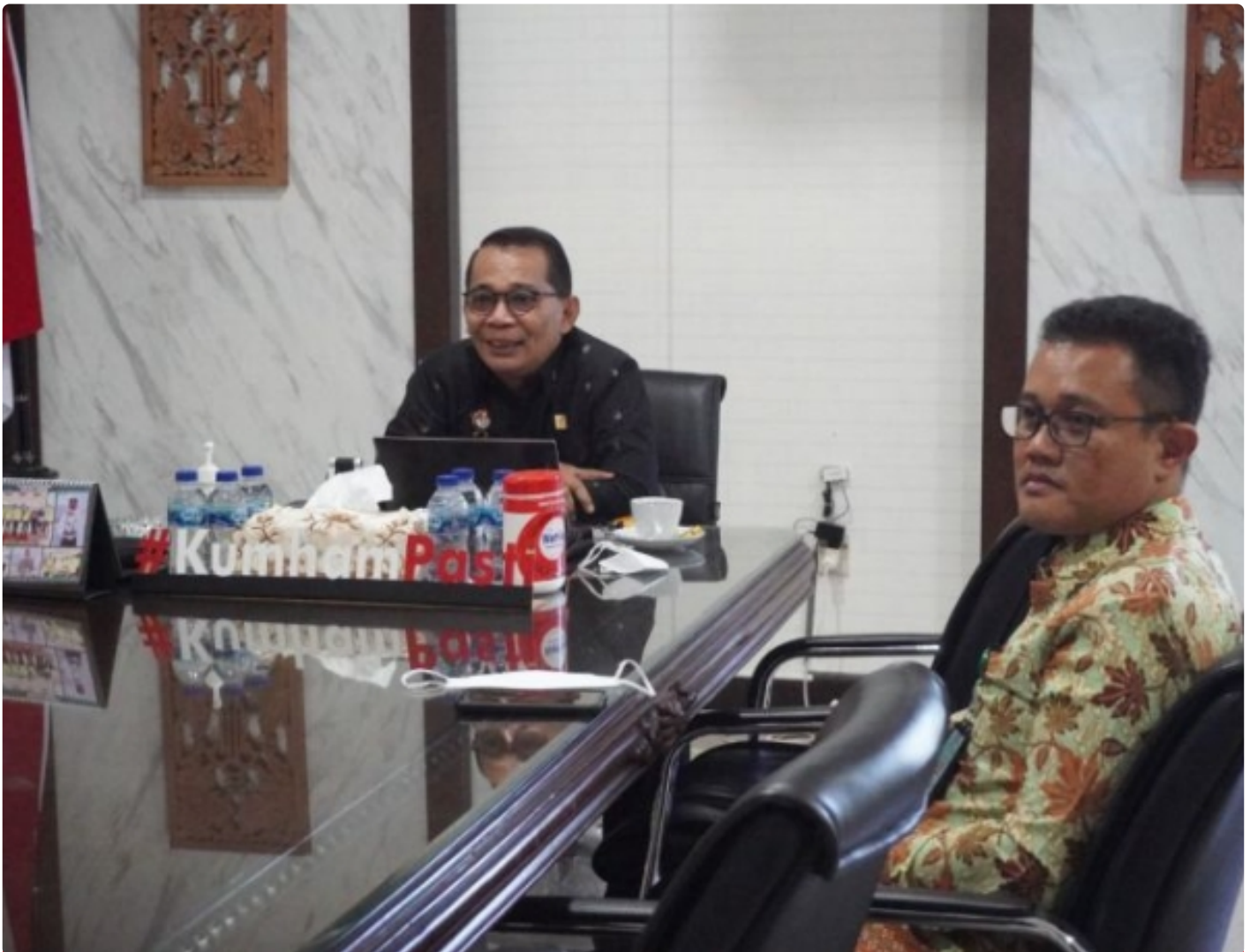
Pimpin Rapat MPWN Jateng, Kakanwil Bahas Pemilihan Wakil Ketua MPW Yang Baru

SEMARANG - Terkoneksi secara virtual melalui Aplikasi Zoom, Kantor Wilayah Kementerian Hukum dan HAM Jawa Tengah menggelar rapat Majelis Pengawas Wilayah (MPW) Notaris Jawa Tengah yang membahas tentang Pemilihan Wakil Ketua MPW baru Tahun 2022, pada Kamis (02/09/2022).